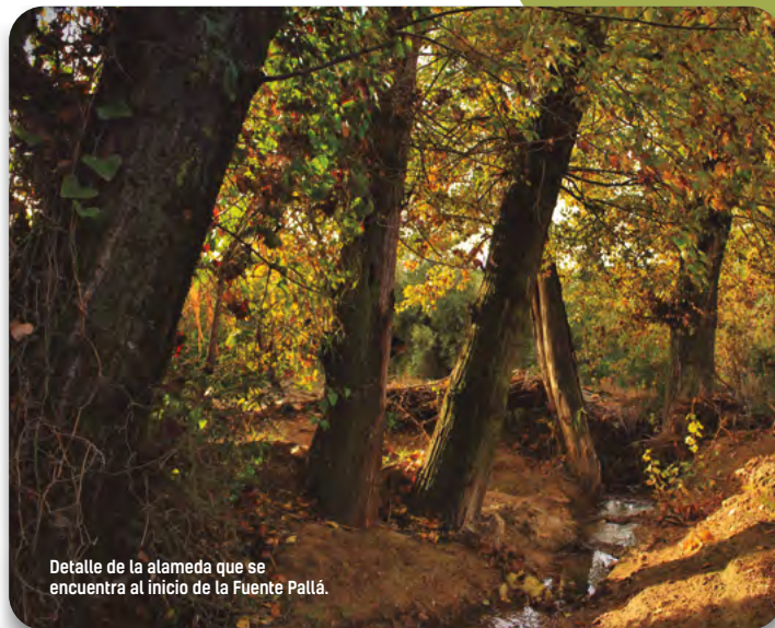
Detalle de la alameda que se encuentra al inicio de la Fuente Pallá.

El arroyo del Barranco continúa aguas abajo buscando desembocar en el arroyo Salado.