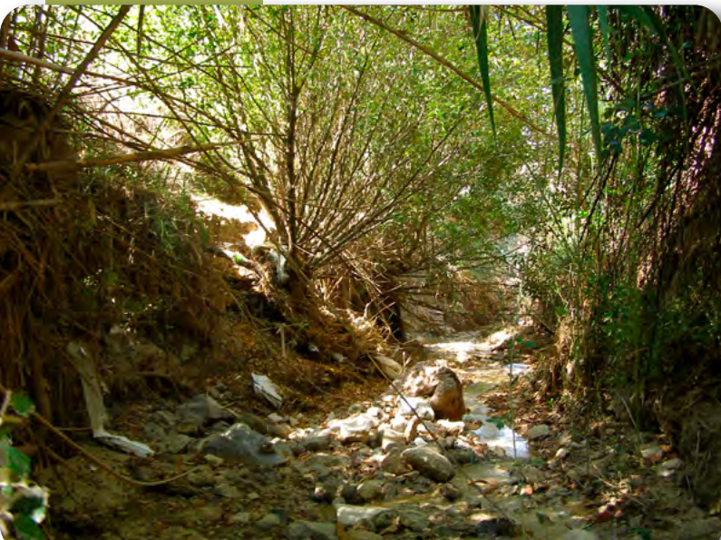
Cauce del arroyo del Barranco.

Nos acercamos al final de la ruta. La vegetación se hace más densa y en este último tramo el álamo blanco es la especie más abundante, formando una alameda grande y profunda.