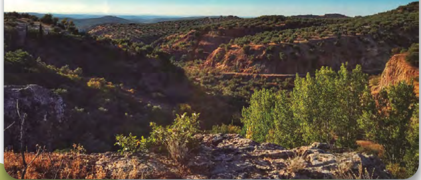
Panorámica desde uno de los miradores de la Ruta de la Senda del Arroyo del Barranco.

La primera parada la haremos junto a unas pitas. Desde aquí tendremos una panorámica desde un punto de vista bajo del entorno de la Fuente Pallá. En la segunda parada, a unos doscientos metros, encontraremos un escarpe de areniscas rojas y multicolores sorprendentes.