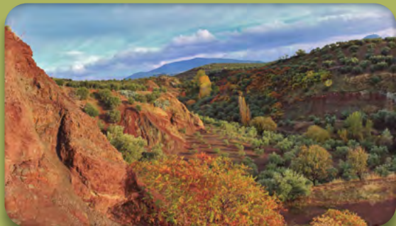
Panorámica desde el oeste de la Fuente Pallá en otoño.

Su riqueza paisajística (colores y texturas), los elementos medioambientales (flora y fauna) y los elementos geológicos hacen de este lugar un espacio sorprendente de la campiña tosiriana.