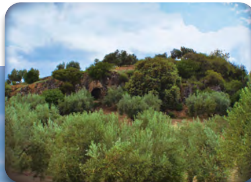
Vista del Cerro de la Covatilla desde el camino de acceso a la ruta.

Paronámica desde el Cerro de la Covatilla.